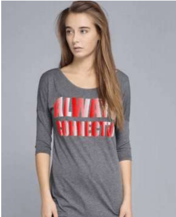
Acabado sin RIP