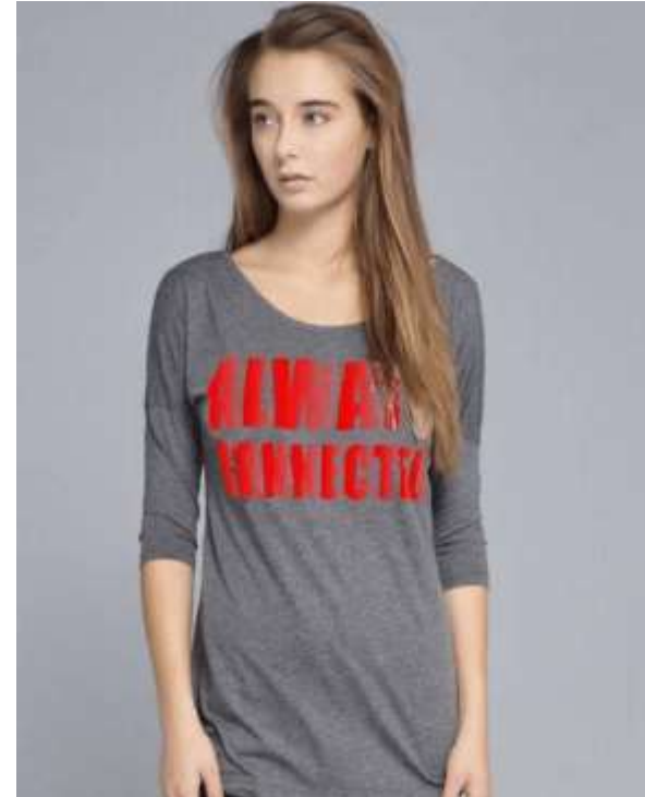
Acabado con RIP